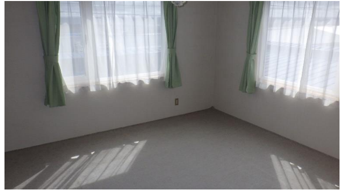
洋 室 (2階)