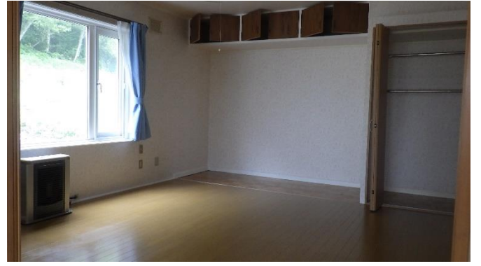
洋 室 (1階)