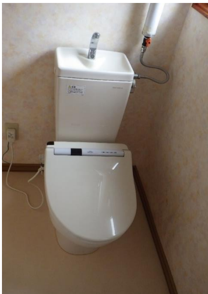
ト イ レ