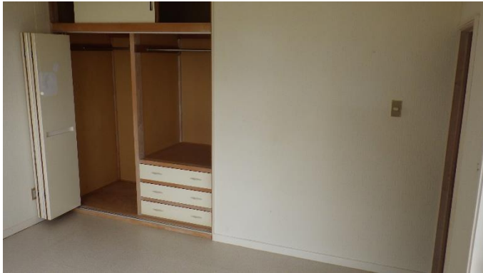
洋 室 (2階)