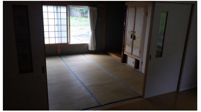
和 室 (1階)