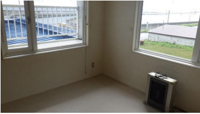
洋 室 (2階)