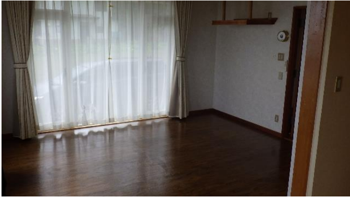
居 間 (1階)