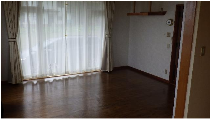
居 間 (1階)