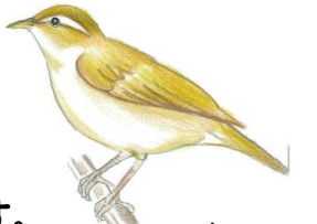
センダイムシクイ

朝のすがすがしい空気を吸い込み、Let's 朝活！ おさんぽ的 自然観察会の参加者募集。