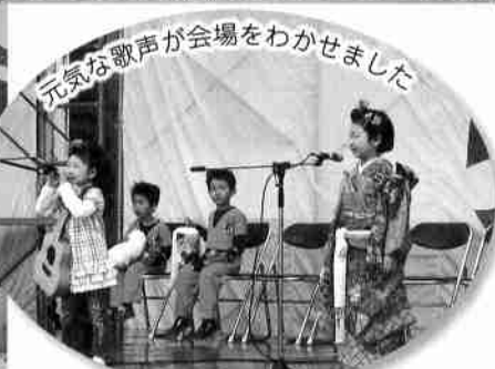
元気の歌声が会場をわかせました