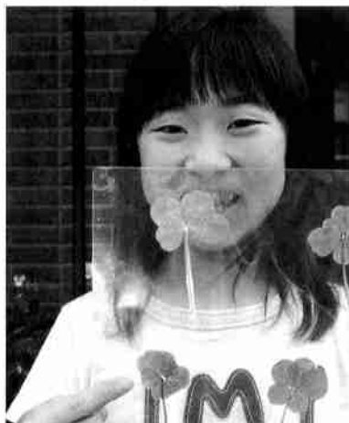
4つ葉から7つ葉まで揃っていました！