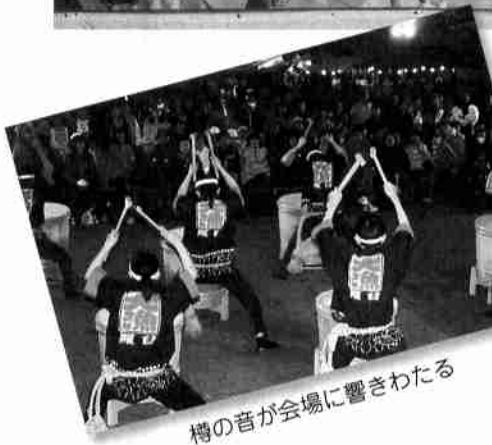
樽の音が会場に響きわたる