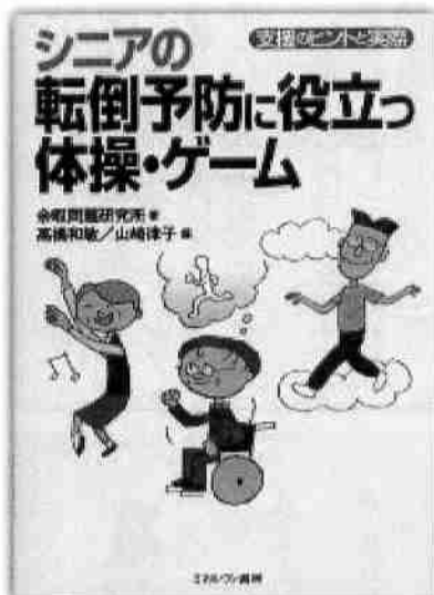
「シニアの転倒予防に役立つ体操・ゲーム」

緊急時の備えにチャート式だからわかりやすい 緊急事態が発生したら…何をすればいいの？何をすべきではないの？介護者のための救命・応急手当ての決定版。