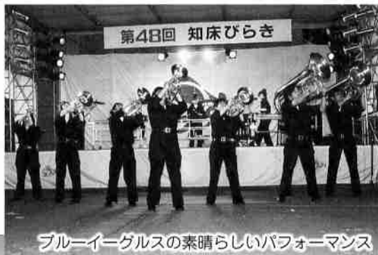
ブルーイーグルスの素晴らしいパフォーマンス