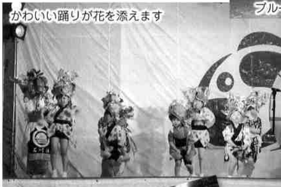
かわいい踊りが花を添えます