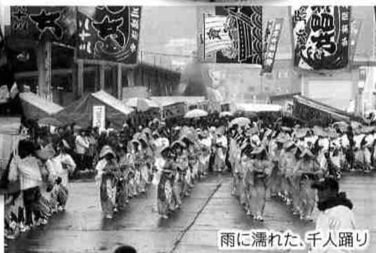
雨に濡れた、千人踊り

町では協働のまちづくりを推進しています。ここでは、町民や団体が自らの意思で「協働のまちづくり」を実践している方々を中心に取上げ掲載して行きたいと考えています。みなさんも「協働のまちづくり」にご参加下さい！