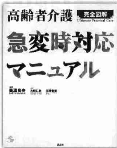
「高齢者介護急変時対応マニュアル」

着るひとにも介護するひとにもラクな服 ちょっととしたケガから寝たきりの方まで「着たい服にこんな工夫があったら」という思いを込めて、既製服のリフォームを中心にした介護服を紹介。