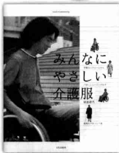
「みんなにやさしい介護服」

着るひとにも介護するひとにもラクな服 ちょっととしたケガから寝たきりの方まで「着たい服にこんな工夫があったら」という思いを込めて、既製服のリフォームを中心にした介護服を紹介。