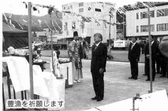
豊漁を祈願します

今年も多く方のご協力をいただき、知床開きが開催されました。天候が不順で、千人踊りなど小雨の降る生憎の天気でしたが、みなさんがこの祭りに参加してくださることで、素晴らしい「知床開き」となりました。ありがとうございました。