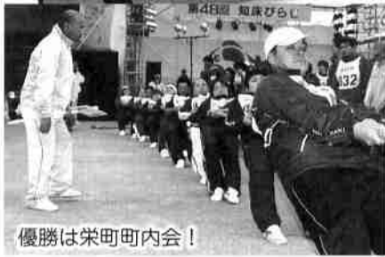
優勝は栄町町内会！