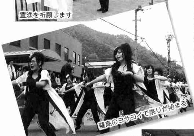
羅高のヨサヨイで祭りが始まる