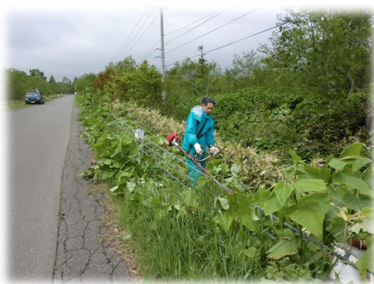
協定農道の草刈り