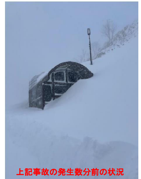
上記事故の発生数分前の状況

・令和4年2月21日に大雪の影響による雪崩が発生し、教職員1名が巻き込まれる事故が発生、今後も同様の被害が発生する可能性がある。