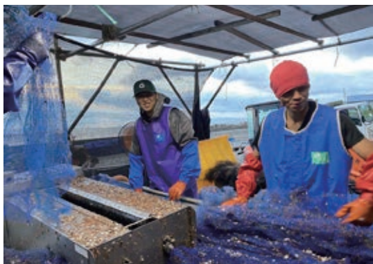
ホタテ養殖事業のおてつたびの様子