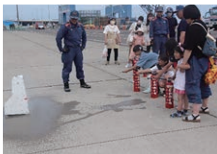
10. 消火器による初期消火訓練 (羅臼消防署・羅臼消防団)