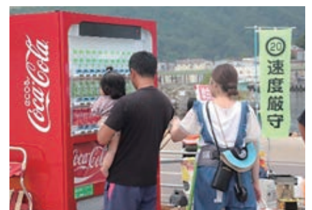
11. 災害時支援用自動販売機による 飲料水の無償提供 (北海道コカ・コーラボトリング株式会社)