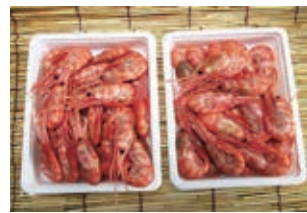
令和4年人気No.1!! 「ポタンエビ」