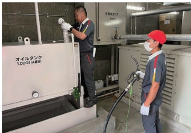
5. 燃料供給訓練 (北海道経済産業局・北海道エネルギー羅臼SS・羅臼アポロ石油)