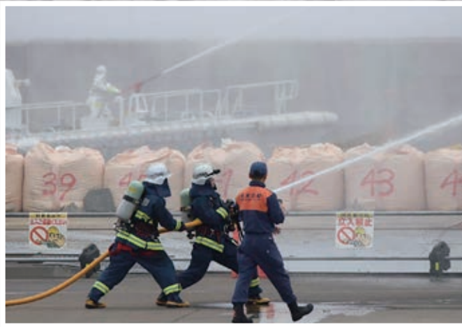
3. 火災船舶消火訓練 (羅臼海上保安署・羅臼消防署・羅臼救難所)