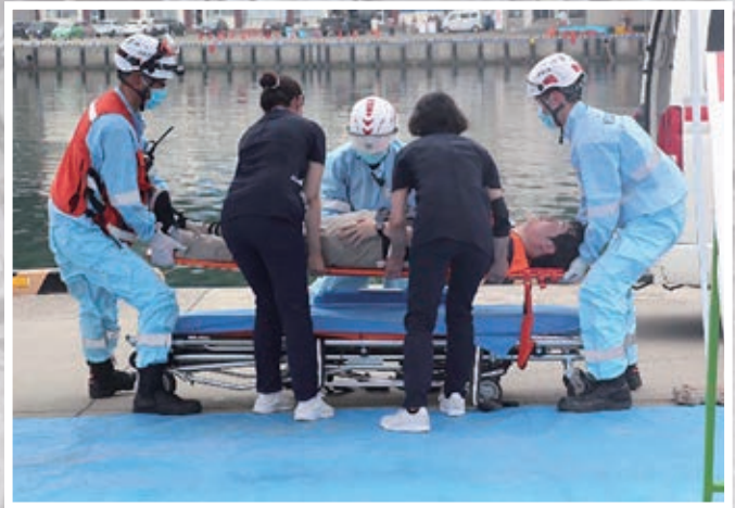
4. 要救助者受入訓練 (知床らうす国保診療所・羅臼消防署)