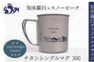
注目を集めてきている 「スノーピークコラボポタンマグ」

羅臼町民が羅臼町にふるさと納税をしても返礼品はもらえませんが、町外の親戚や友人に羅臼町ふるさと納税のご利用を是非宣伝していただければ幸いです。