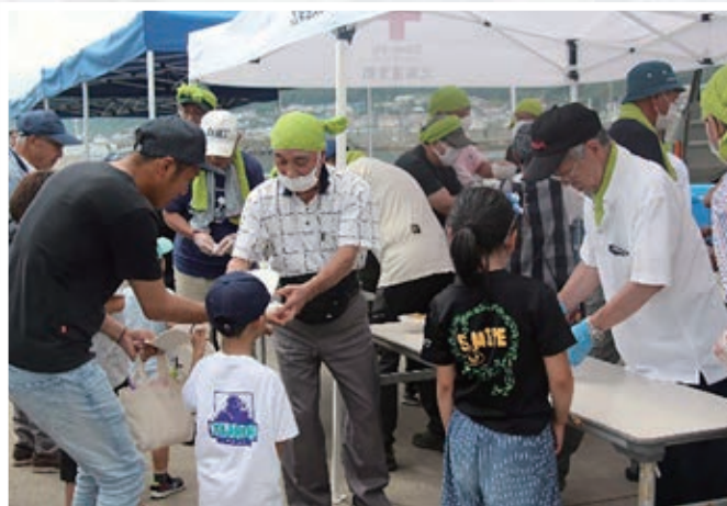
7. 炊き出し訓練 (羅臼町連合町内会・羅臼町女性団体連絡協議会・LPガス協会羅臼分会・陸上自衛隊)