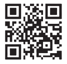
羅臼町防災ハザードマップ

近年、羅臼町では暴風や雪崩による住宅や家財への被害が発生しており、地震による被害についてもいつ発生するか分かりません。防災ハザードマップ等を活用し、自分の住んでいる場所ではどのような被害が想定されるかを再確認して、保険・共済への加入がまだな方はぜひ加入の検討を、既に参加している方は、現在の補償対象・内容が十分であるか見直してみましょう。