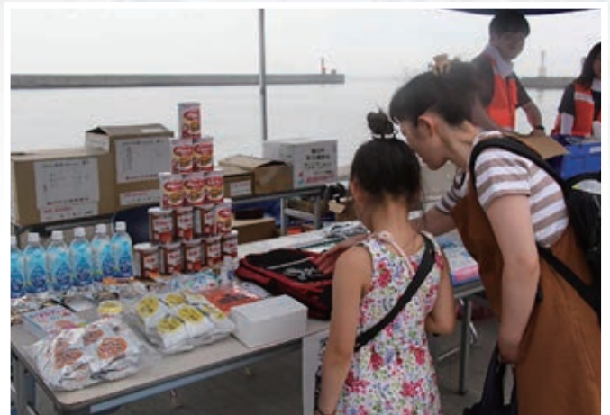
8. 防災備蓄品展示・啓発物資配布 (羅臼町)