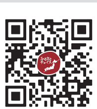
ポータルサイト 「ふるさとチョイス」