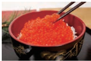
毎年人気!! 「さけ醤油いくら」