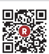
ポータルサイト 「楽天」