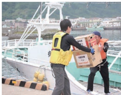
2. 緊急物資海上輸送訓練