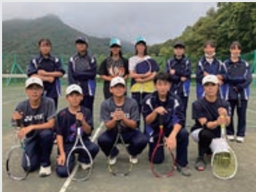
新体制となったソフトテニス部