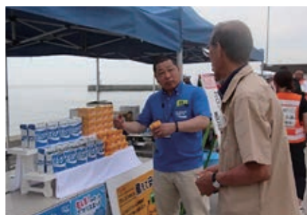
9. カロリーメイトロングライフ、 ポカリスエット粉末展示・配布 (大塚製薬株式会社)