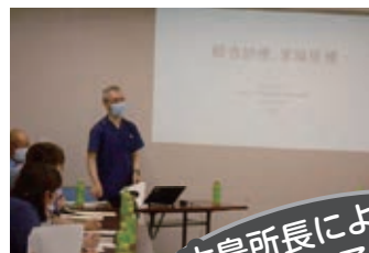
木島所長による講演会の様子です

これからも高いコスト意識をもってみなさんにとって最適な医療をお届けできるよう努めて参ります。