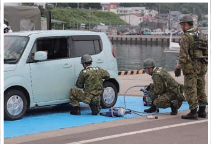
6. 事故車両からの要救助者救出訓練 (陸上自衛隊第27普通科連隊)