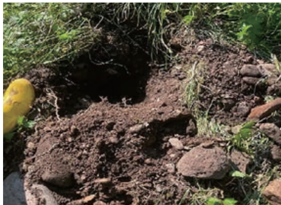
今年は食料が乏しいため、草の根を掘って食べた掘跡が各所で目立ちました。

7～8月は、ヒグマの対応が増えています。今年はずでに、駆除の頭数も今までで二番目の多さになりました。人の活動域に近づくようなクマを生み出さないよう、皆様の日ごろからのご配慮をよろしくお願いします。