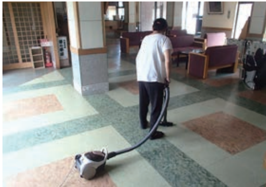
宿泊施設のおてつたびの様子

8月中旬、町内の宿泊業4件、ホタテ養殖業1件において、おてつたびを通して全国に求人募集を行ったところ、すぐに応募があり、早速8月下旬より羅臼町でのお手伝いがスタート