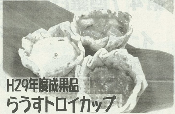
H29年度成果品 らうすトロイカップ

驚くほど柔らかい身の「ドスイカ」を3種のソースに絡め、昆布出汁香る特製生地のカップにのせました。