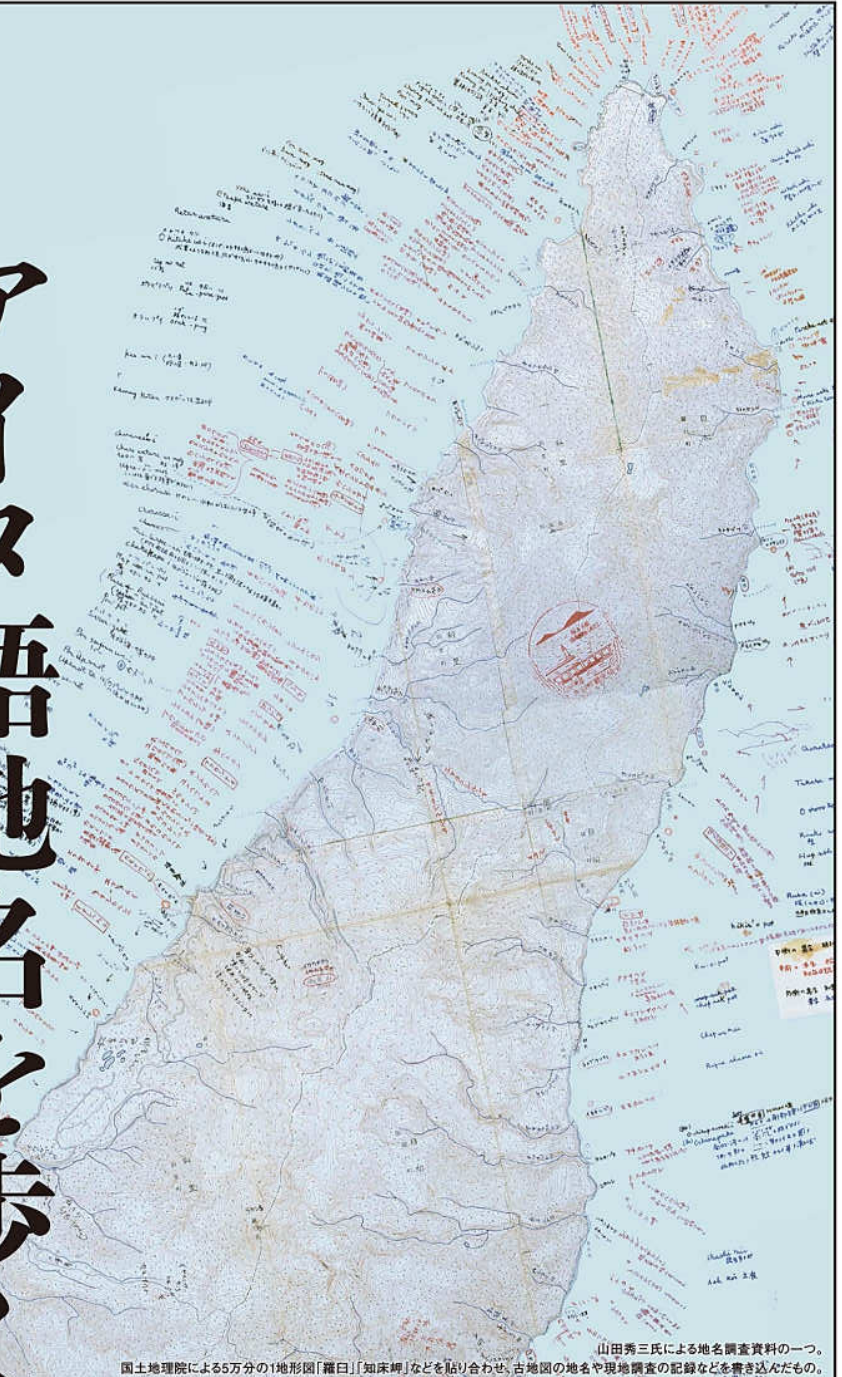
山田秀三氏による地名調査資料の一つ。 国土地理院による55万分の1地形図「羅白」[知床岬]などを貼り合わせ、古地図の地名や現地調査の記録などを書き込んだもの。