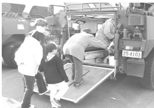
自衛隊車輛の避難訓練も体験できます！