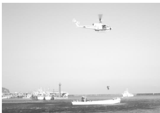
海上保安署による漂流者救助訓練