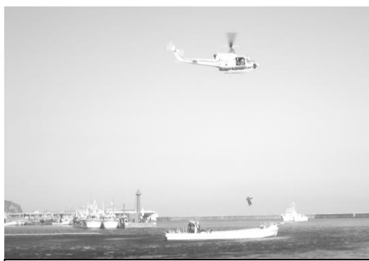
海上保安署による漂流者救助訓練