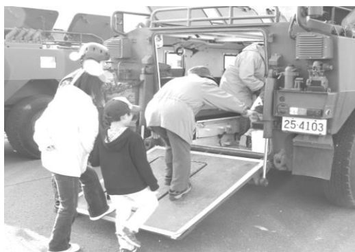
自衛隊車輛の避難訓練も体験できます!