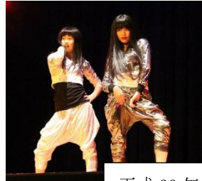
平成28年度 町民小劇場へ衣裳をみんなで揃えて出演！！