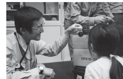
知床ウトロ学校でのクマ授業の様子

地元の学校でのクマ授業などの教育活動、ワシヤトドのモニタリング調査など、知床財団が独自に取り組んでいる活動に使わせていただきます。