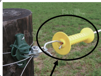
オレンジのハンドルが目印