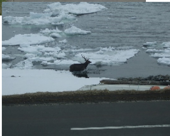
<海を歩くエゾシカ>