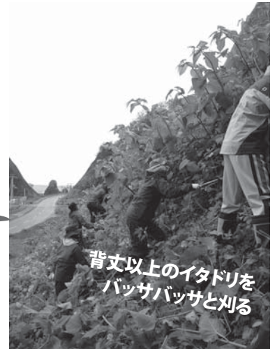
(写真：ウトロ東の道路脇の斜面)