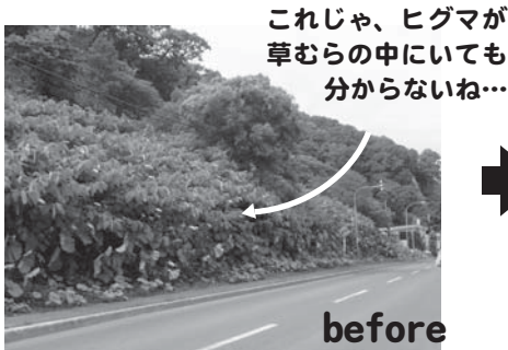
(写真：羅臼の海岸町付近)