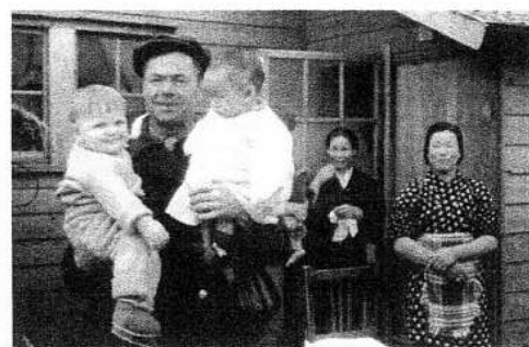
※掲載されている写真