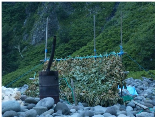
【川の水をくみ上げ、沸かした温泉は旅の疲れを癒やしてくれました】