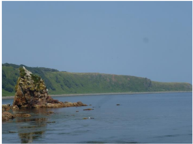
【岬の先端が見えてきました】