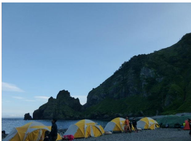
【モイルス湾：ベースキャンプ地】

翌日からチャレンジ隊（小学6年～中学3年生）は知床岬に向かって進みます。私はチャレンジ隊のスタッフとして同行しました。念仏岩やカブト岩などかなり急斜面の崖を安全ベルトを締めながら、登り降りるかなりしんどい道のりでした。途中で熊に遭遇し、爆竹を鳴らしてもなかなか道を譲ってくれません。「ここは、自分の道