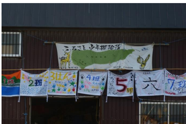
【班で作った旗を掲げています】