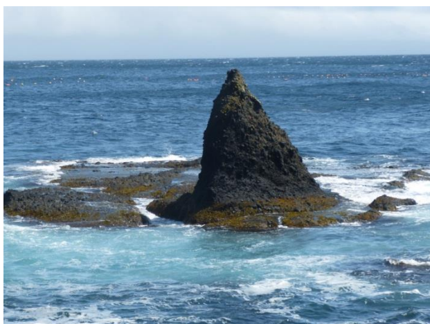
【海の色や岩が神秘的！】