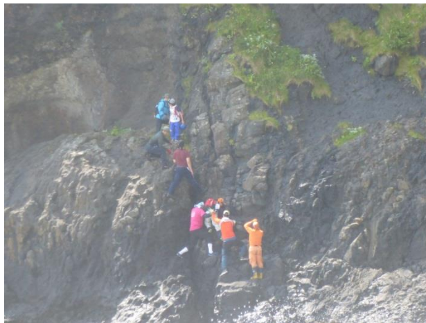
【険しい崖や岩を登り降りします】