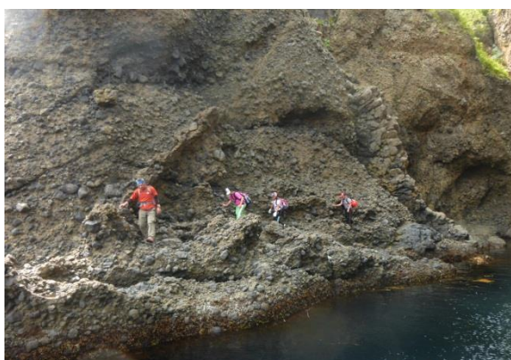
【帰りも険しい道のりでした】

この探険隊の行事は決して楽しい事だけではなく、身体的にも精神的にもきつい事もたくさんあります。でも、集団生活をしながら共に辛い事も楽しい事も経験し、友情が深まったり、相手を思う気持ちを養えたり、自分自身を強くするきっかけになると思いました。私もこの体験から、得た事はたくさんありました。羅臼に来なければ、こんな貴重な経験もできなかったし、参加できるように勤務調整してくれた師長を始め、スタッフの皆様にご感謝します。