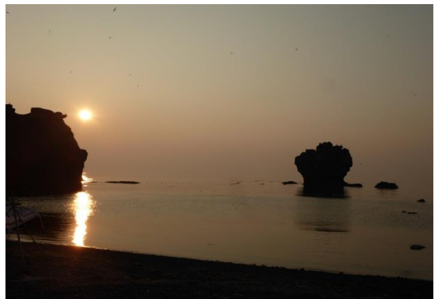
【啓吉湾での夕日は最高！！】

翌日は、水着に着替え、子供達と一緒に海で泳ぎ、岩からダイビングしたりと、楽しみました。午後から船でわんぱく隊が待つ、ベースキャンプ地まで戻ります。出発から一度もお風呂に入れず、川で洗髪したり、身体を拭いたりしか出来なかったのですが、わんぱく隊が作ってくれたお手製の「モイレウシの湯」（川から水を吸い上げ、沸かしたお風呂）に少し浸ることができ、幸せだな～と声が漏れる位でした。1日ここで、わんぱく隊とチャレンジ隊が釣や楽器作りなどの活動をして、最終日また相泊まで向けて来た道のりを帰ります。この日もかなり暑く、足の痛みで過呼吸になった子供を励ましながら、相泊まで来ると出迎えていた子供達の親が安堵の表情で出迎えていた姿を見て、すっかり私も泣いてしまいました。子供達も、日焼けした顔が遅しく見え、この探険隊で確実に成長したんだなと改めて感じました。そして私は・・・5泊6日鏡を見ることがなかったので、家に帰ってきてビックリです「あなたは誰??」あまりにも日焼けした顔に鏡を何度も見直してしまいました。でも、その姿にここにも一人成長した自分があるなど苦笑いです。