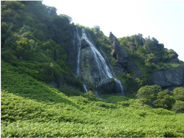
【女滝と男滝がありました】

この辺は、同じ日本にいるとは思えない位、すばらしい景色にまたまた興奮します。灯台に登ると、さらに美しい景色を堪能できました。さらに進み、斜里側のチャレンジ隊のゴール地点「啓吉湾」に到着です。ここで羅臼では見られない、沈んでゆく夕日を見ながら、ロマンチックに浸っていました。夕日が沈むとランタンの明かりで夕食、そのまま砂浜で寝袋にくるまりながら、満点の星空を見て、またまたロマンチックに浸りながらの就寝でした。